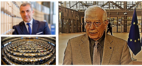
Led by MEP Loucas Fourlas, 33 Members of the European Parliament sent a letter to the EU High Representative urging the complete and immediate withdrawal of the Azerbaijani forces from the territory of the Republic of Armenia. eafjd.eu

November 16. The MEPs condemn Azerbaijan’s aggression. They demand, that the Azerbaijani armed forces immediately and completely withdraw from the territory of the Republic of Armenia and are urge the EU External Action Service to put pressure on Azerbaijan to stop and prevent the violation of the territorial integrity of Armenia.