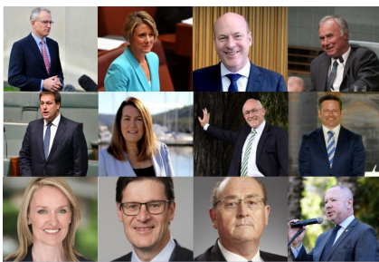
Federal and State Parliamentarians to Join Armenian National Committee of Australia Annual Gala Next Saturday 19th February 2022 Read more at anc.org.au

Australia's Minister for Communications, Urban Infrastructure, Cities and the Arts, Hon. Paul Fletcher MP and Deputy Leader of the Opposition in the Senate, Senator Hon. Kristina Keneally will headline the list of Federal, State and Local Government dignitaries at the Armenian National Committee of Australia's Annual Gala at the Museum of Contemporary Art in Sydney on Saturday 19th February 2022.