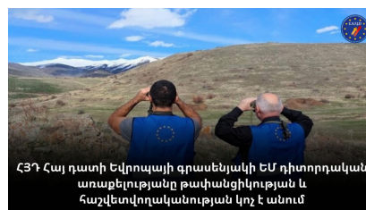
ՀՅԴ Հայ դատի Եվրոպայի գրասենյակի ԵՄ դիտորդական առաքելությանը թափանցիկության և հաշվետվողականության կոչ է անում

Հայաստանի Հանրապետության պաշտպանության նախարարությունն օգոստոսի 15-ին հաստատել է, որ Վերին Շորժայի ուղղությամբ ադրբեյջանական զինուժը թիրախավորել է Հայաստանում Եվրոպական միության դիտորդական առաքելության: Չնայած վերջինիս նախնական հերքումին, հրապարակվեցին տեսաապացույցներ, որոնք հաստատեցին ինչպես ԵՄ դիտորդների, այնպես էլ նրանց մեքենաների ուղղությամբ կրակոցների փաստը, ինչից հետո միայն ԵՄ առաքելությունը սոցցանցից հեռացրեց ՀՀ պաշտպանության նախարարությանը