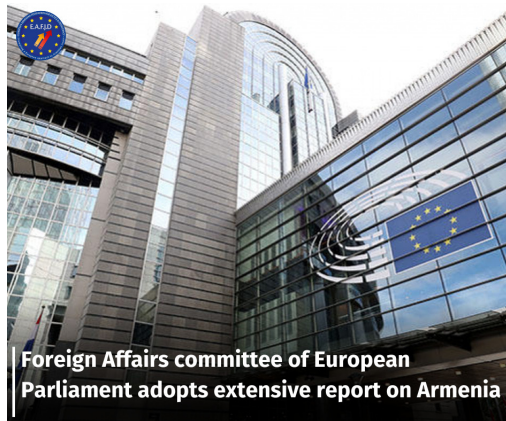
Foreign Affairs committee of European Parliament adopts extensive report on Armenia

վրախորհրդարանի արտաքին հարաբերությունների մշտական հանձնաժողովը փետրվարի 9-ին ընդունել է ԵՄ-Հայաստան հարաբերությունների 2021-2022թթ. զեկույցը, որում կարևոր անդրադարձներ կան ՀՀ-ԵՄ հարաբերությունների վերաբերյալ: Չեկույցն անդրադառնում է նաև Արցախի հակամարտությանը, ինչպես նաև Հայաստանի և Ադրբեջանի միջև հարաբերությունների կարգավորման գործընթացին: