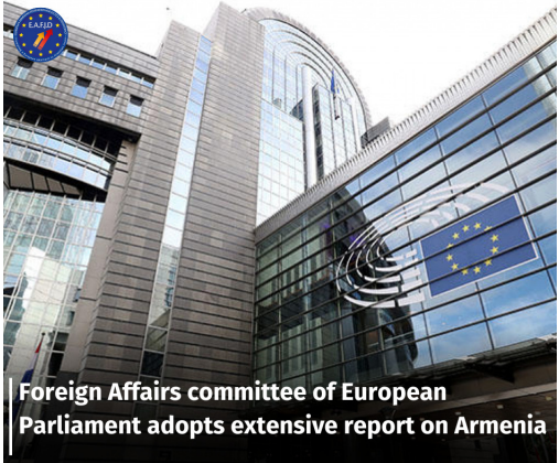
Foreign Affairs committee of European Parliament adopts extensive report on Armenia

conflict in Nagorno Karabakh / Artsakh and the normalization of relations between Armenia and Azerbaijan. The EP Foreign Affairs Committee condemns the military incursions by Azerbaijan into the sovereign territory of Armenia since May 2021. Besides highlighting the Azerbaijani violations of the interstate border and urging the return to initial positions, the Committee confirms that the Azerbaijani aggression of September 2022 was not related to the Nagorno-Karabakh conflict. The report reaffirms that a comprehensive peace treaty between Armenia and Azerbaijan must guarantee the integrity of the sovereign territory of Armenia, the rights and the security of the Armenian population residing in Nagorno-Karabakh.